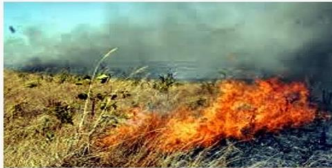
Incêndio destruindo vegetação nativa na Chapada dos Veadeiros, município de Alto Paraíso, Estado de Goiás.

Marque F para falso e V para verdadeiro em relação às queimadas .