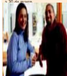
O inverno começa em 21 de junho e vai até 22 de setembro.