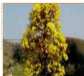
A primavera vai de 23 de setembro até 21 de dezembro.

AS ESTAÇÕES DO ANO SÃO: PRIMAVERA, VERÃO, OUTONO E INVERNO.