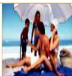
O verão vai de 22 de dezembro a 20 de março.