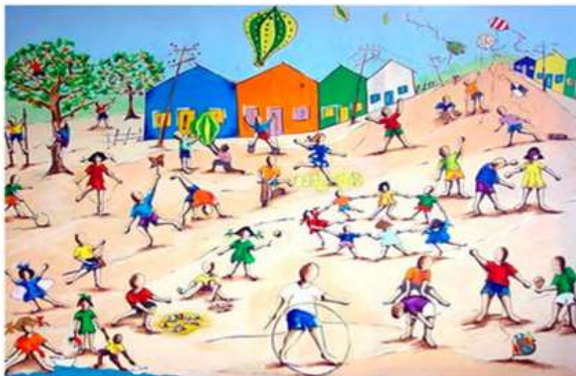
Brincadeiras Infantis de Ivan Cruz

A imagem abaixo é uma obra de arte do artista Ivan Cruz. Observe-a com bastante atenção para fazer a interpretação dela.