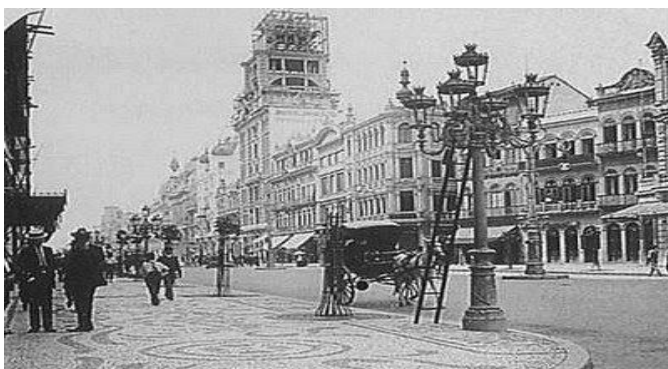
Luzes da Ribalta

A reforma Pereira Passos buscou adaptar a cidade também para os automóveis. É nesse período que o Rio de Janeiro vê a chegada da energia elétrica e a reorganização do espaço urbano carioca. O prefeito proibiu ainda a atuação de ambulantes.