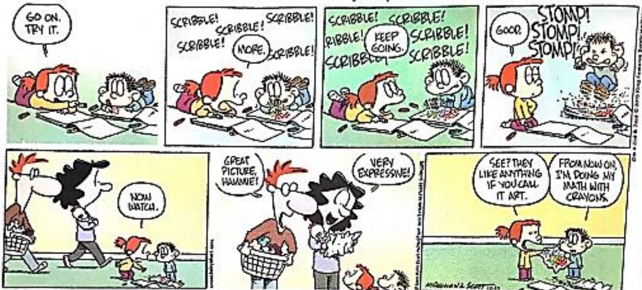
KIRKMAN, Rick; SCOTT, Jerry. December 27, 2009. Available at: < www.thecomicstrips.com/store/add.php?iid=42412 >. Accessed in: August 2014.

- Mark the correct statements about the text.