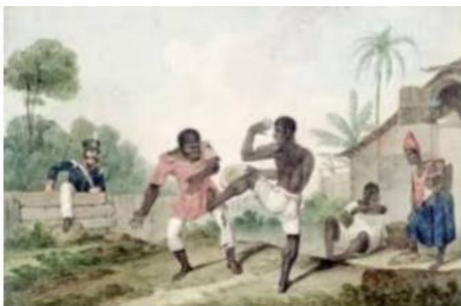
Figura 01 - Os negros lutando na aquarela de Augustus Earle capoeira - Danse de la guerre, (1835)

Em nossos dias, a capoeira, se tornou muito popular, mas o preconceito contra a cultura afro-brasileira ainda persiste.