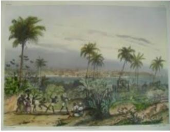
Figura 02 - Gravura de Johann Moritz Rugendas intitulada San-Salvador.