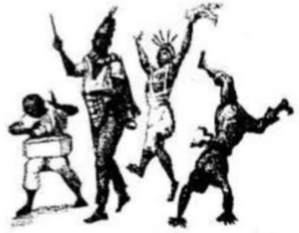
Figura 04 – Negros Volteadores (Debret – 1824)

1) Observe as figuras e descreva o que mais chamou sua atenção em todas elas, ou em apenas uma em específico.