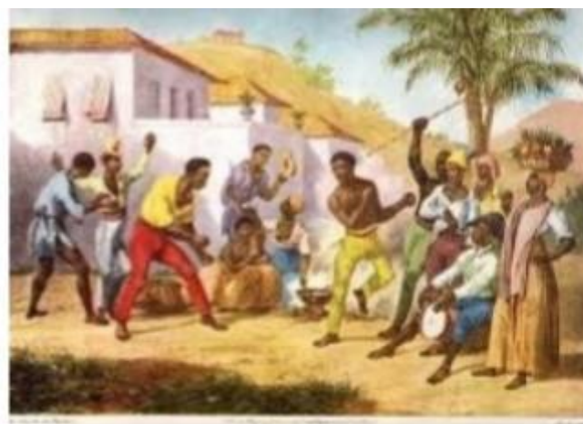
Figura 03 - Óleo sobre tela de Johann Moritz Rugendas intitulada Jogar