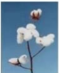
( ) algodão

4 – Observe algumas plantas abaixo e assinale apenas as que não podem ser tocadas ou colocadas na boca por serem perigosas.