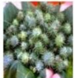
( ) mamona