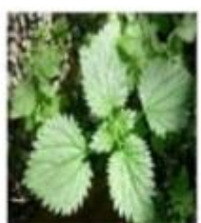
( ) urtiga