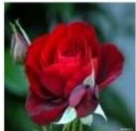
( ) rosa