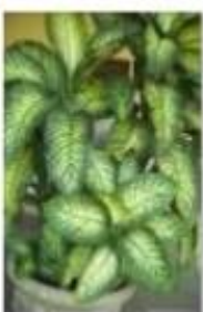
( ) comigo-ninguém-pode