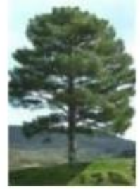
( ) pinho