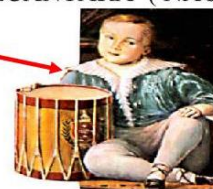
O príncipe Pedro de Alcântara.

DOM PEDRO DE ALCÂNTARA TER IDADE PARA GOVERNAR.