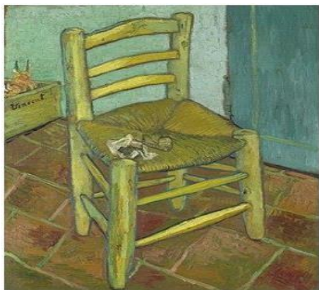
Van Gogh. A cadeira de Vicent com seu cachimbo.1888.