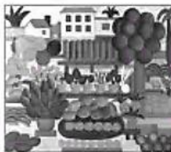
Vitória, 1922. Samba, 1925. A feira II, 1925.