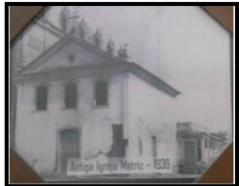
ANTIGA IGREJA MATRIZ - 1939

7. ESCREVA UMA FRASE BEM BONITA SOBRE A CIDADE DE SANTO ANTÔNIO DE PÁDUA.