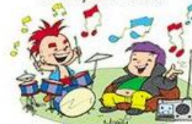
EVITE POLUIÇÃO SONORA