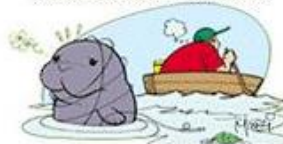
NÃO JOGUE LINHA DE PESCA NA ÁGUA, POIS ANIMAIS PODEM FICAR PRESOS E MORRER