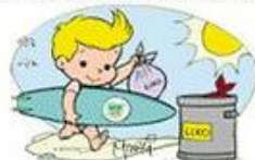
LEVE UM SACO DE LIXO NA PRAIA, JUNTE O REFUGO, FECHÉ BEM E JOGUE NUMA LATA DE LIXO