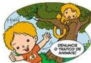
PROTEJA OS ANIMAIS