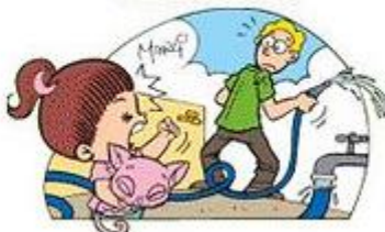
NAO LAVE A CALÇADA COM MANGUEIRA