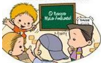
PARTICIPE DE PROJETOS DE SUA COMUNIDADE