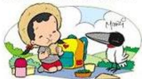
NÃO UTILIZE EMBALAGENS DE ISOPOR EM PIQUENIQUES