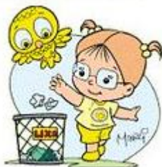
JOGUE O LIXO NO LIXO