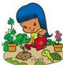
CUIDE DAS PLANTAS