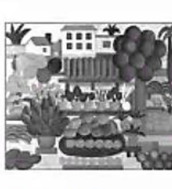
Vitória, 1922. Samba, 1925. A feira II, 1925.