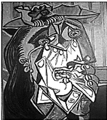
A mulher que chora, 1937. Pablo Picasso