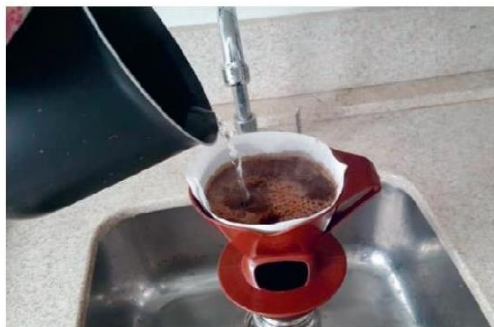
Imagem de Silvana R. Tonon