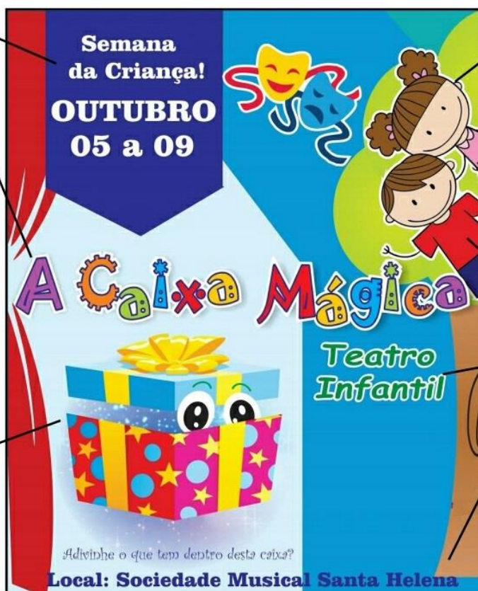
Ilustração de acordo com o tema do cartaz.

Palavras principais destacadas com: tamanho, posição, cor e forma.