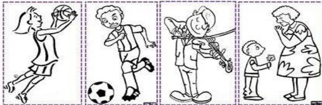
Monday Tuesday Wednesday Thursday