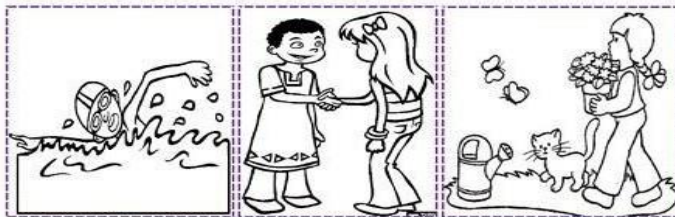
Friday Saturday Sunday