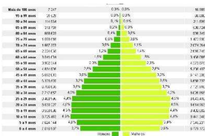
Pirâmide Etária Brasileira em 2010 ( Dados do IBGE )

Observe o gráfico abaixo, demonstrativo da pirâmide etária brasileira de acordo com o Censo de 2010: