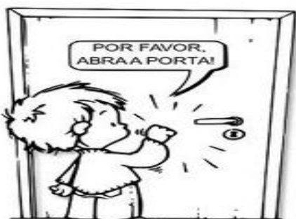
BATER À PORTA ANTES DE ENTRAR