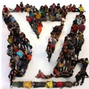
Pictures of People, de 2009, criou o logo da Louis Vuitton com pessoas e virou estampa de um lenço comemorativo

Vik Muniz trabalha com lixo e materiais descartáveis.