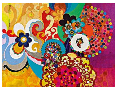
O Mágico, de Beatriz Milhazes

Meu Limão – obra de Beatriz Milhazes que a colocou novamente no posto de artista brasileira viva com obra mais cara vendida em leilão.