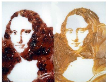
Retrato de Monalisa em geleia e pasta de amendoim

Já Vik Muniz (nascido no ano de 1961) é um dos grandes nomes da arte brasileira graças a materiais geralmente descartados. Muniz usa lixo e componentes como chocolate e açúcar em suas obras. Ele é tão famoso internacionalmente que no ano de 2010 ganhou um vídeo documentário sobre suas obras intitulado "Lixo Extraordinário". "Não é bem o material ou o tema, o inusitado é como essas coisas se relacionam", ressaltou o artista.