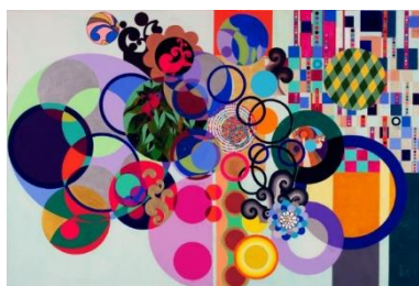
Mais uma das obras de Milhazes

A artista iniciou sua carreira nas artes em 1981, ano em que ingressou na Escola de Artes Visuais do Parque Lage. Na década, Beatriz Milhazes fez parte das exposições que caracterizavam a Geração 80, grupo de artistas que buscavam retomar a pintura em contraposição à vertente conceitual dos anos 1970, com pesquisa de novas técnicas e materiais. Mas só a partir de 1990 que Milhazes passa a destacar-se em mostras internacionais nos Estados Unidos e Europa e integra acervos de museus como o MoMa, Guggenheim e Metropolitan em Nova York.