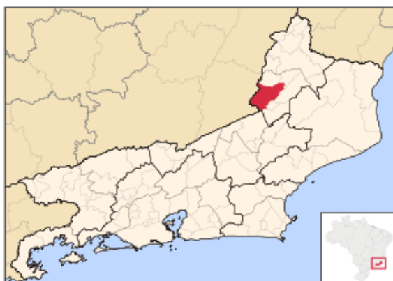
Localização de Santo Antônio de Pádua no Rio de Janeiro

Veja a localização do município nos mapas abaixo: