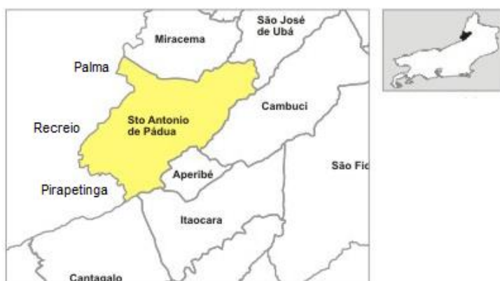
Municípios que fazem divisa com Santo Antônio de Pádua