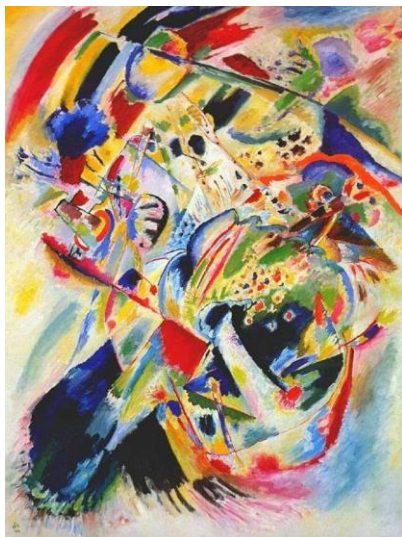
Wassily Kandinsky - 1914 - Pintura nº 201 Óleo sobre tela 163x123, cm

Na Alemanha surge o movimento denominado "Der blaue Reiter" (O Cavaleiro Azul) cujos fundadores são os Kandinsky, Franz Marc entre outros. Uma arte abstrata, que coloca na cor e forma a sua expressividade maior. Estes artistas se aprofundam em pesquisas cromáticas, conseguindo variações espaciais e formais na pintura, através das tonalidades e matizes obtidos. Eles querem um expressionismo abstrato, sensível e emotivo. Com a forma, a cor e alinha, o artista é livre para expressar seus sentimentos interiores, sem relacioná-los a lembrança do mundo exterior. Estes elementos da composição devem Ter uma unidade e harmonia, tal qual uma obra musical.