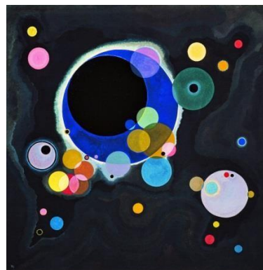
Wassily Kandinsky - 1926 - Diversos Círculos 323 Óleo sobre tela 139,7x139,