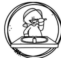
ESCOVAR OS DENTES