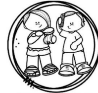
PENTEAR OS CABELOS

1- DESEMBARALHE AS LETRAS E COMPLETE A FRASE DE ACORDO COM O DESENHO.