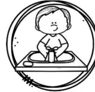
LAVAR AS MÃOS