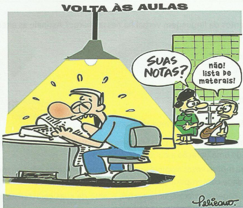
PELICANO. Volta às aulas. Disponível em: < http://jestudante.blogspot.com.br/2011/06/charges-da-educacao-brasileira.html >. Acesso em: 27 ago. 2014.

15 Segundo a charge, a urbanização e o desflorestamento foram benéficos ou prejudiciais à população indígena? Justifique sua resposta.